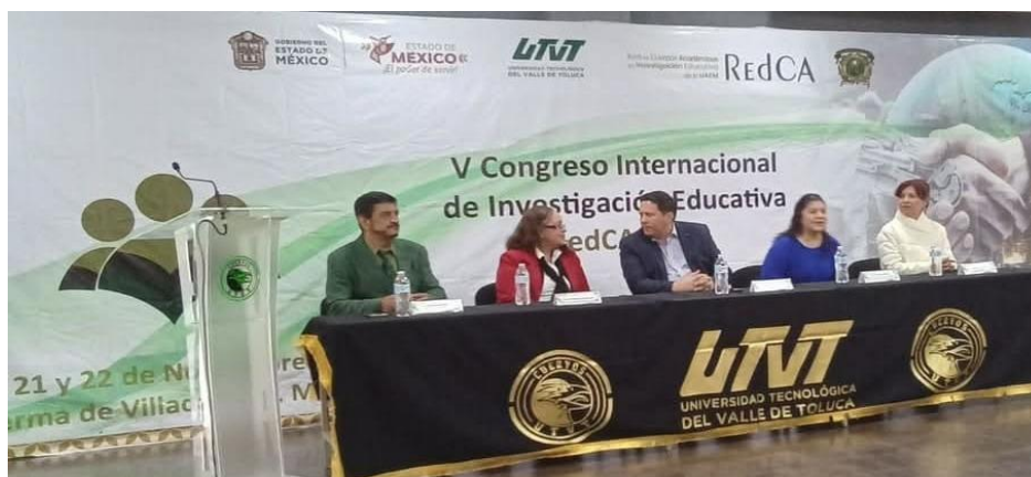
Foto: Inauguración del V Congreso Internacional de Investigación Educativa RedCA 2024